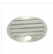
Tropfgitter Ø 9,9 cm in Edelstahl GRI2