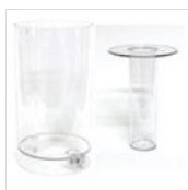
Saft- und Eisbehälter rund (4l) CONT-ICE 2 (4L)