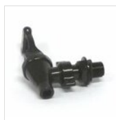
Standardzapfhahn schwarz RUB-P