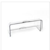
FANTASY Haube GN ohne Befestigungssystem CLOCHE GN