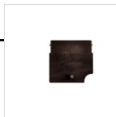
HOLZDECKEL FÜR ART. 50300730 50300731

Aus produktionstechnischen Gründen sind die genannten Informationen unverbindlich und können ohne vorherige Ankündigung geändert werden. Verkaufsbedingungen sind auf Anfrage erhältlich. Da es sich bei dem Material Holz um ein Naturprodukt handelt, sind die abgebildeten Farben nur Richtwerte. Eventuelle Farb- und Maserungsunterschiede gegenüber Mustern und früheren Lieferungen sind kein Reklamationsgrund. Alle Teile und Materialien mit direktem Kontakt mit Lebensmitteln sind nach den gesetzlichen Vorschriften für den Lebensmittelkontakt geprüft und zugelassen. Alle Rechte vorbehalten - ©Ze Pé.