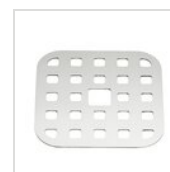
Quadratisches Tropfgitter 11,2 x 11,2 cm in Edelstahl 01 GRI

Aus produktionstechnischen Gründen sind die genannten Informationen unverbindlich und können ohne vorherige Ankündigung geändert werden. Verkaufsbedingungen sind auf Anfrage erhältlich. Da es sich bei dem Material Holz um ein Naturprodukt handelt, sind die abgebildeten Farben nur Richtwerte. Eventuelle Farb- und Maserungsunterschiede gegenüber Mustern und früheren Lieferungen sind kein Reklamationsgrund. Alle Teile und Materialien mit direktem Kontakt mit Lebensmitteln sind nach den gesetzlichen Vorschriften für den Lebensmittelkontakt geprüft und zugelassen. Alle Rechte vorbehalten - ©Ze Pé.