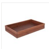
NATURE Boîte à pain GN 1/1 15A01150