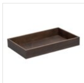
PRÉSENTOIR EN BOIS GN 1/1 82100013