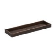
Présentoir en bois GN 2/4 82100017