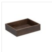
PRÉSENTOIR EN BOIS GN 1/2 82100015