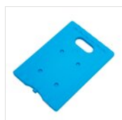
Pack de glace 20 x 29 cm 50303453BR