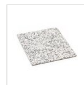
FANTASY Élément de granit - couleur claire GN 1/2 GRANITO CHIARO