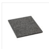
FANTASY Élément de granit - couleur sombre GN 1/2 GRANITO SCURO