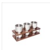
Porte-verre à vin/glacette NATURE 51525710