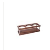
Porte- bouteilles NATURE pour 3 bouteilles 51525030