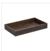
ESPOSITORE IN LEGNO GN 1/1 82100013