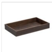
ESPOSITORE IN LEGNO GN 1/1 82100013