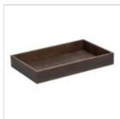
ESPOSITORE IN LEGNO GN 1/1 82100013