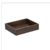
ESPOSITORE IN LEGNO GN 1/2 82100015