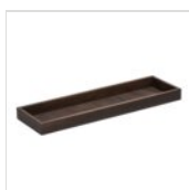
Espositore in legno GN 2/4 82100017