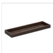
Espositore in legno GN 2/4 82100017